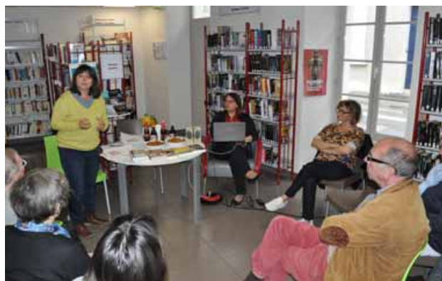
Dans le cadre du festival Littératures européennes, les lecteurs de la médiathèque choisiront leur roman.

Puis, chaque lecteur a reçu un dossier complet. « Chaque ouvrage m'a vraiment donné envie de faire des recherches assez poussées », partage Fabienne Laroche. Sur chaque dossier assez épais a été collée une reprodu-