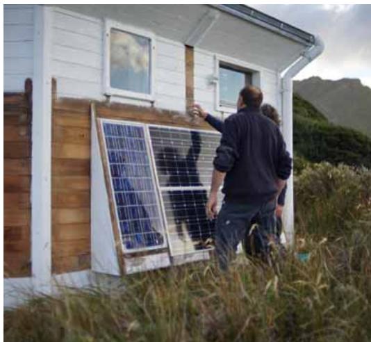
L'équipe rochelaise a remplacé les anciens panneaux solaires par deux nouveaux, plus efficaces.