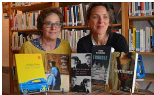
La sélection 2019 est 100 % d'origine néerlandophone.

Le mode de scrutin a changé depuis trois ans. Il n'y a plus un vote par bibliothèque, mais un par lecteur. Ils étaient plus de 1 500 à participer l'an dernier, une performance d'autant plus remarquable que les écrivains en lice sont souvent totalement inconnus. Le millésime 2019 se concentre sur des auteurs néerlandophones, traduits en français. « Pour la littérature de fiction, 75 % des traductions concernent l'anglo-saxon. Nous sommes vraiment dans la découverte, avec