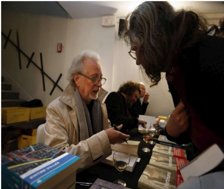
▲ Stefan Hertmans, signant son roman ce samedi midi au théâtre de Cognac, après la proclamation du 16e Prix des lecteurs.

Hertmans repartira de Cognac avec une dotation de 1500 € (offerte par le groupe de matériaux Garandeau) et sera invité à une résidence d'auteur d'un mois à la villa Marguerite-Yourcenar, près de la frontière belge, qu'il connaît déjà bien.