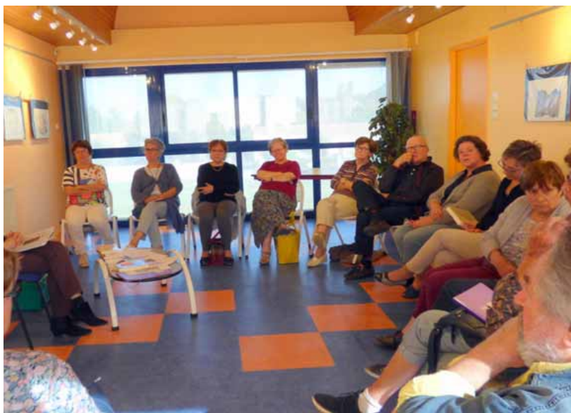
Un groupe d'une vingtaine de personnes a participé au lancement du Prix des lecteurs à la médiathèque Ernest-Labrousse, mercredi.

Avec un départ à la mi-mai, la médiathèque de Barbezieux-Saint-Hilaire a respecté le calendrier qui prévoyait le lancement du prix à partir du 15 avril. La prochaine date importante sera maintenant le 19 octobre