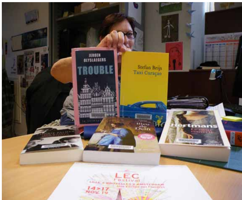
Demain soir, les lecteurs désirant participer au Prix des lecteurs pourront découvrir les auteurs sélectionnés.

Parmi ces lecteurs figurent jusqu'à maintenant en Haute Saintonge ceux des bibliothèques d'Archiac, Chevanceaux, Montguyon et Jonzac, chacune étant en lien avec la BDP (Bibliothèque départementale