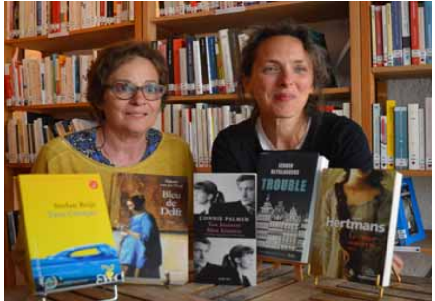
La sélection 2019 est 100 % d'origine néerlandophone.

Le mode de scrutin a changé depuis trois ans. Il n'y a plus un vote par bibliothèque, mais un par lecteur. Ils étaient plus de 1500 à participer l'an dernier, une performance d'autant plus remarquable que les écrivains en lice sont souvent totalement inconnus. Le millésime 2019 se concentre sur des auteurs néerlandophones, traduits en français. « Pour la littérature de fiction, 75 % des traductions concernent l'anglo-saxon. Nous sommes vrai-