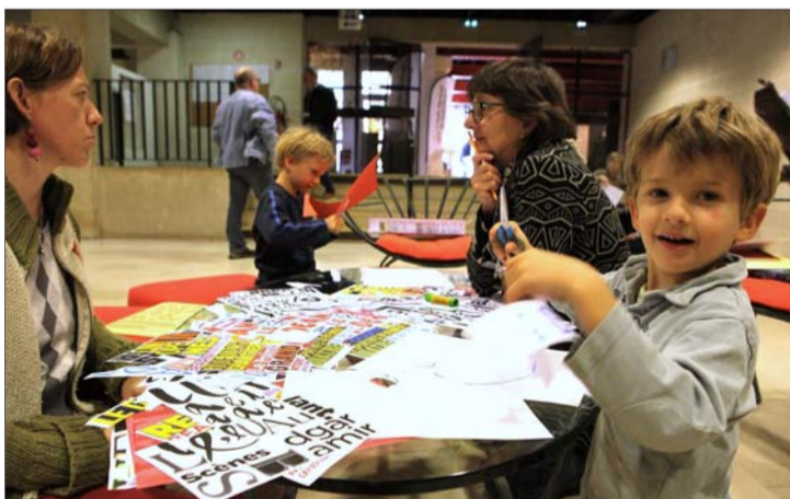
Si leur espace était peut-être moins identifié, les enfants n'ont pas été oubliés de cette 30 e édition du festival Littératures européennes.

a reçu le 5 e prix Alé (Adolescents, lecteurs... et Européens), remis par les collégiens, pour «L'huile d'olive ne meurt jamais» (L'école des loisirs).